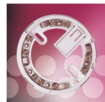
Base sin componentes electrónicos