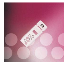
Tarjeta de direcciones patentada XPERT